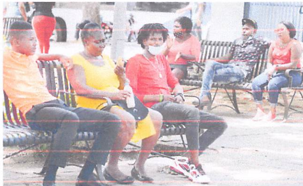
En distintos lugares públicos muchas personas son captadas sin mascarillas.

DESCUIDO. Un gran porcentaje de los dominicanos ha disminuido el uso de mascarillas y ha descuidado el distanciamiento físico, luego de que el Gobierno flexibilizara las medidas restrictivas como parte de la desescalada para la eliminación del toque de queda.